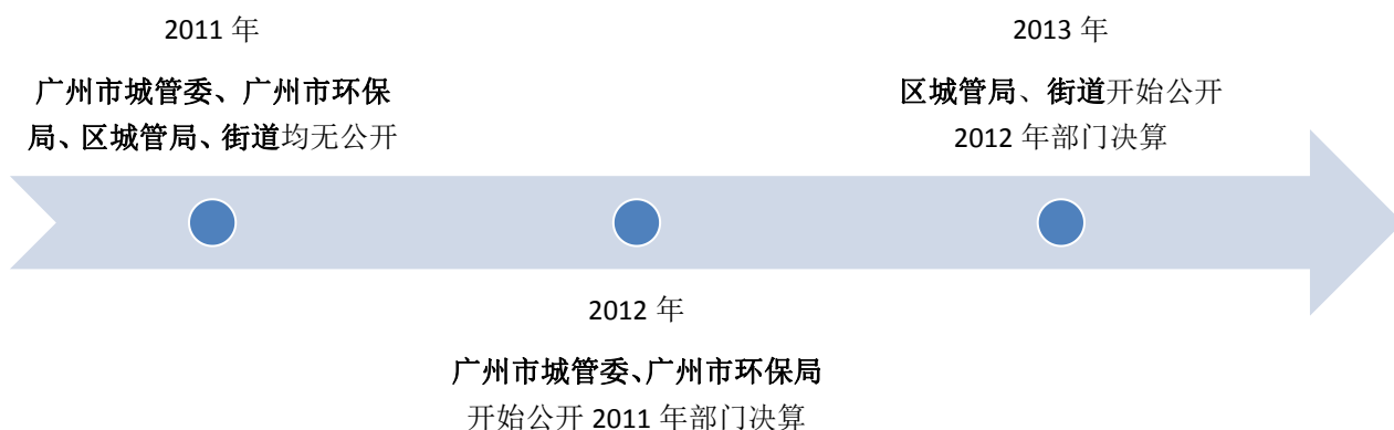
图3 各部门决算公开时间轴

截至2015年6月，除了一个街道仅公开了2013年决算而没有公开2012年决算以外，其他部门均公开了2012年及2013年的部门决算文件。可见，政府部门的决算公开工作已全面铺开。